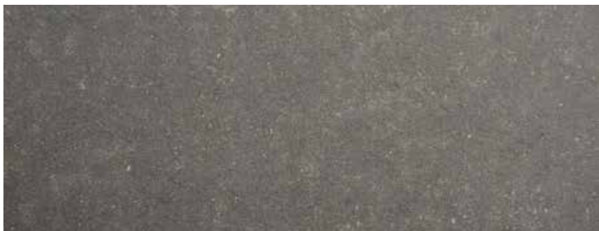
CALIZA SAN VICENTE ENVEJECIDA