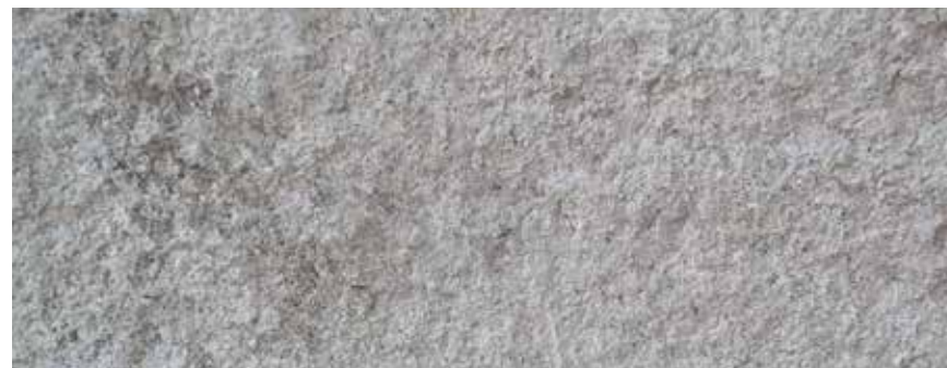
CANTERA BLANCA HUIXQUILUCAN