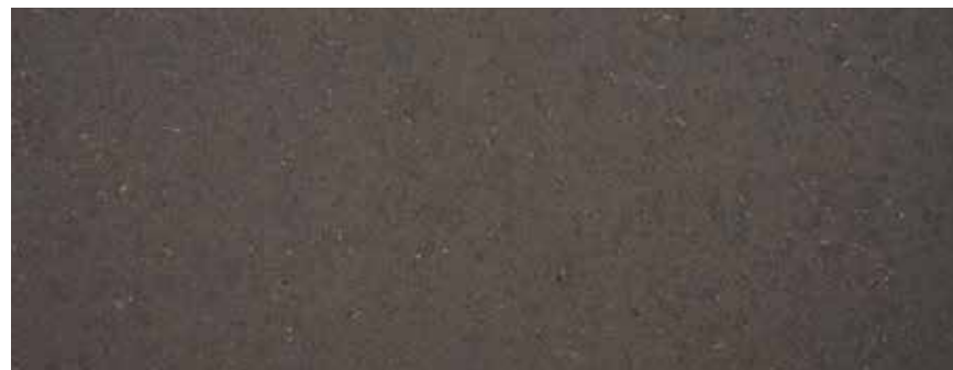
CALIZA ARGENT FLAM+ANTIC