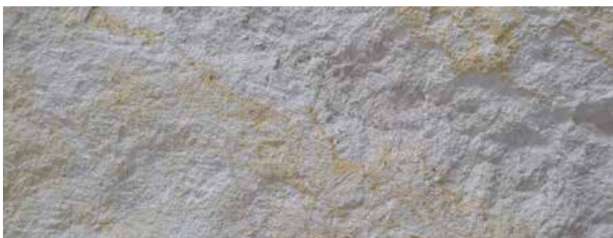
CANTERA CREMA GALARZA