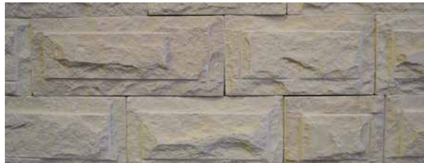
CINTILLO DEL DESIERTO