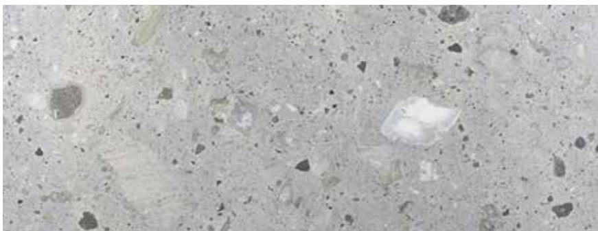
CANTERA BLANCA MEXICANA