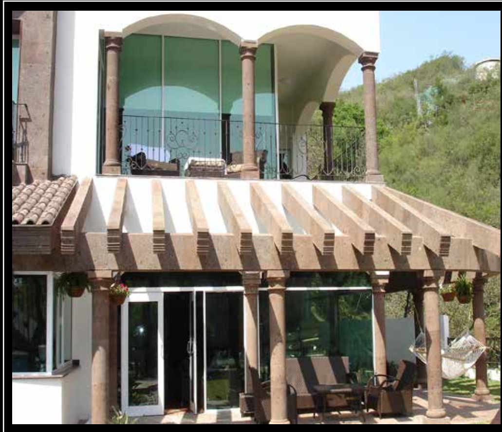
CANTERA MEXICANA DESÉRTICA