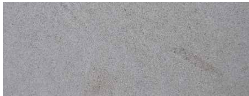
CANTERA BLANCA DIAMANTE