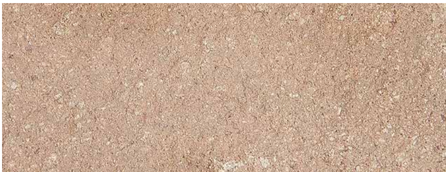
CANTERA HUIXQUILUCAN ROSA