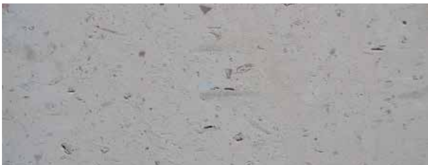
CANTERA PIÑON ATEMAJAC