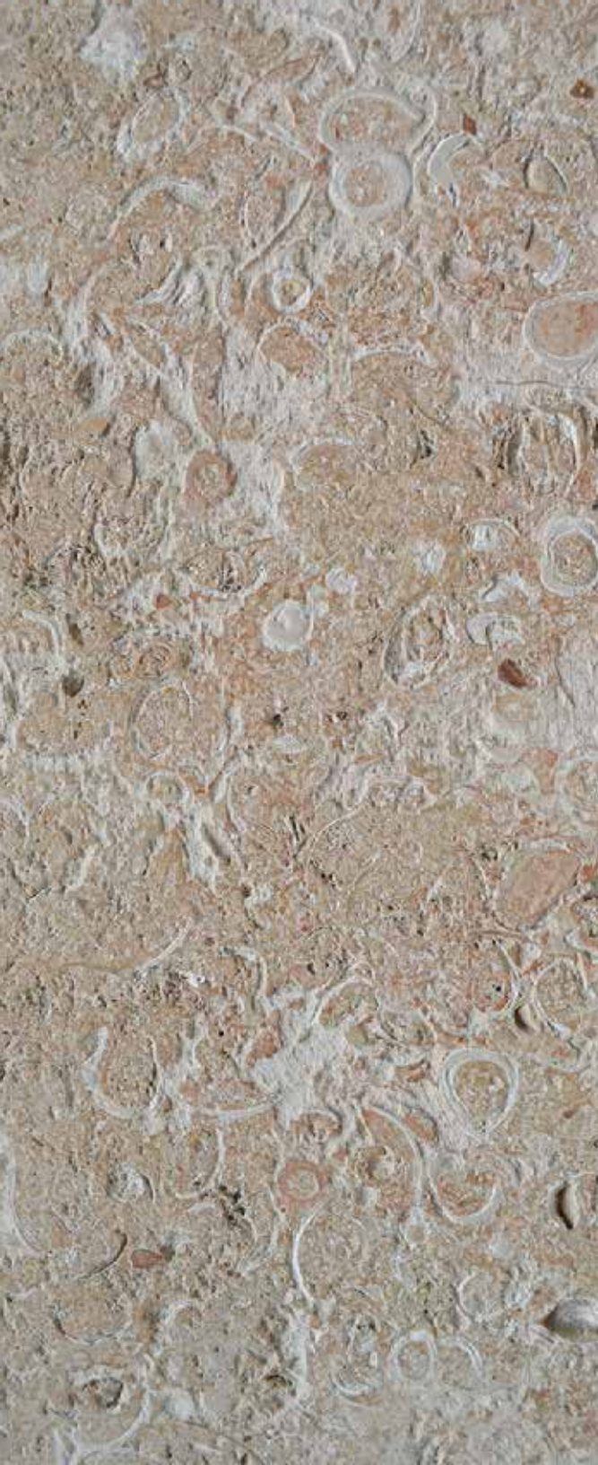
CANTERA CONCHUELA APOMAZADA Procedente de la zona maya.