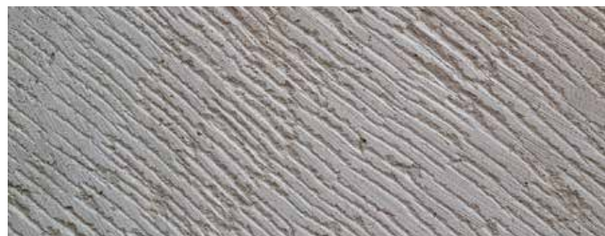
CANTERA BLANCA GALARZA LABRADO FINO