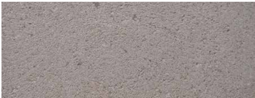
CANTERA ROSA DIAMANTE