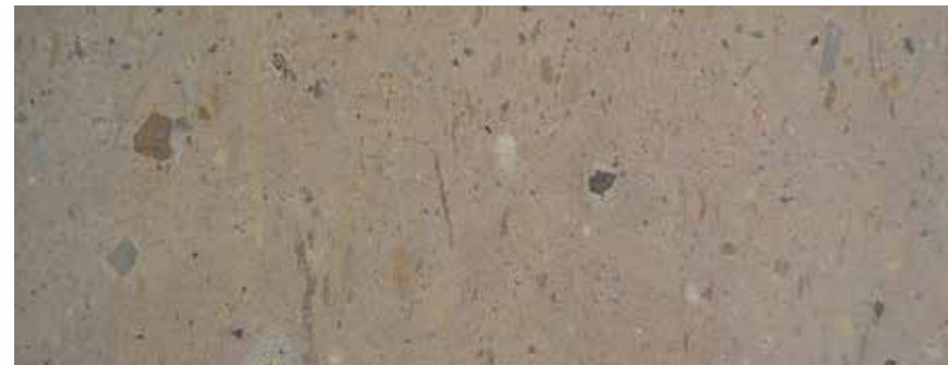
CANTERA MEXICANA DESÉRTICA