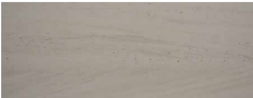
CALIZA MOCA CREME