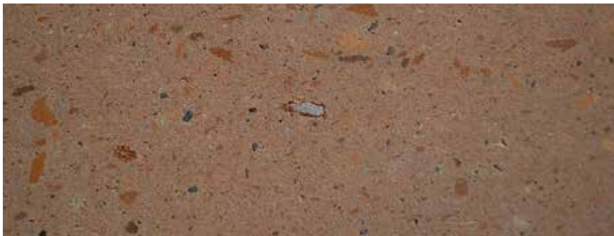
CANTERA NARANJA MEXICANA