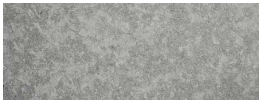
CALIZA GRIS CATALAN BUZARDEADO