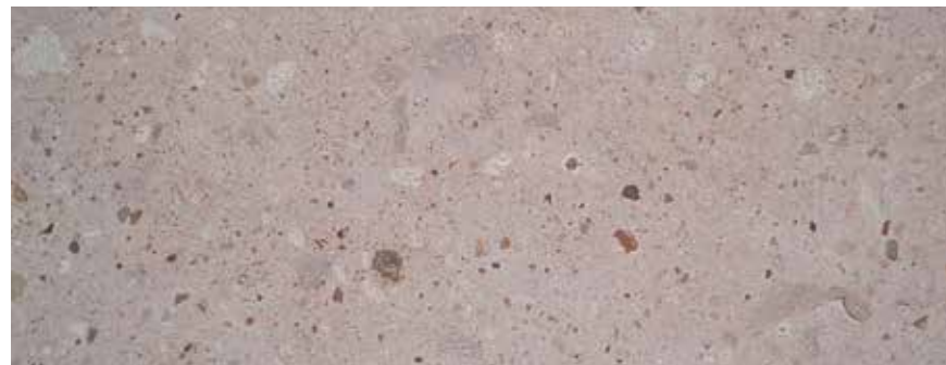
CANTERA ROSA MEXICANA