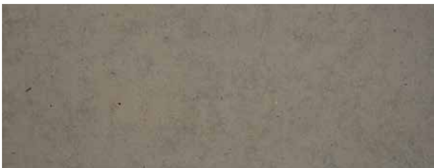
CALIZA VAL VERDE