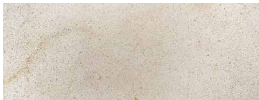
CALIZA CREMA EUROPA