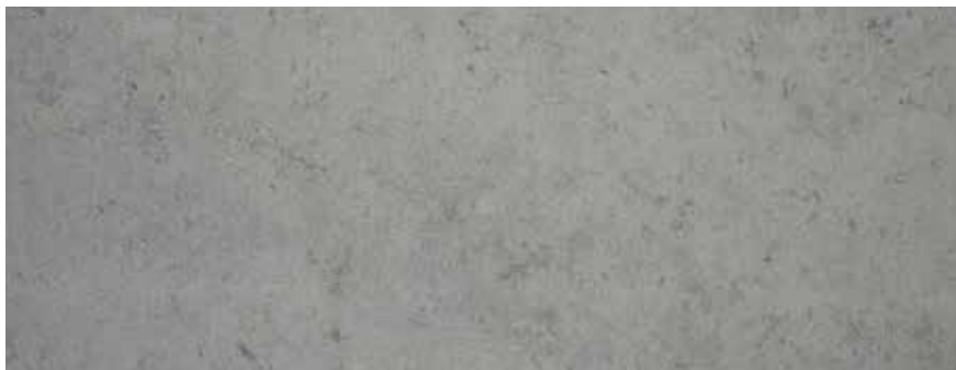
CALIZA ALBA APOMAZADA