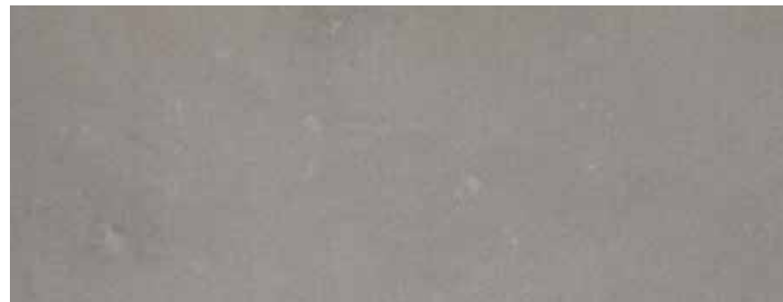
CALIZA OLIVE GREY FLAMEADA