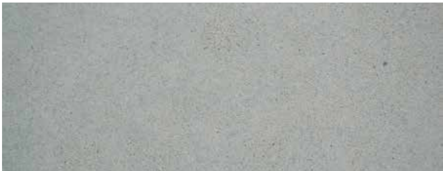
CANTERA VERDE GUANAJUATO