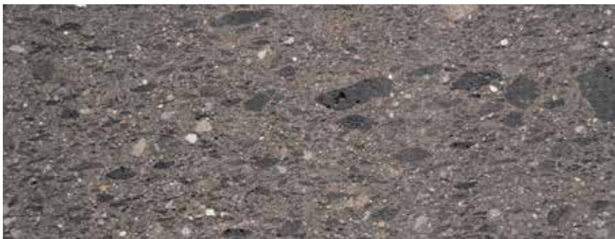
CANtera MEXICANA NEGRA