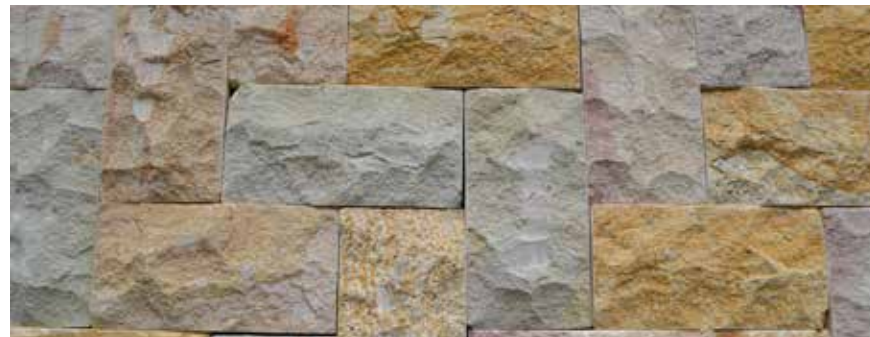
HERMOSA AGUASCALIENTES 15X30