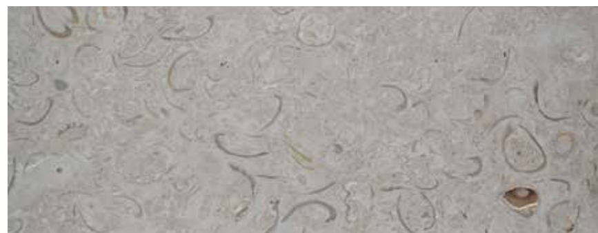
CANTERA CONCHUELA CON FÓSILES