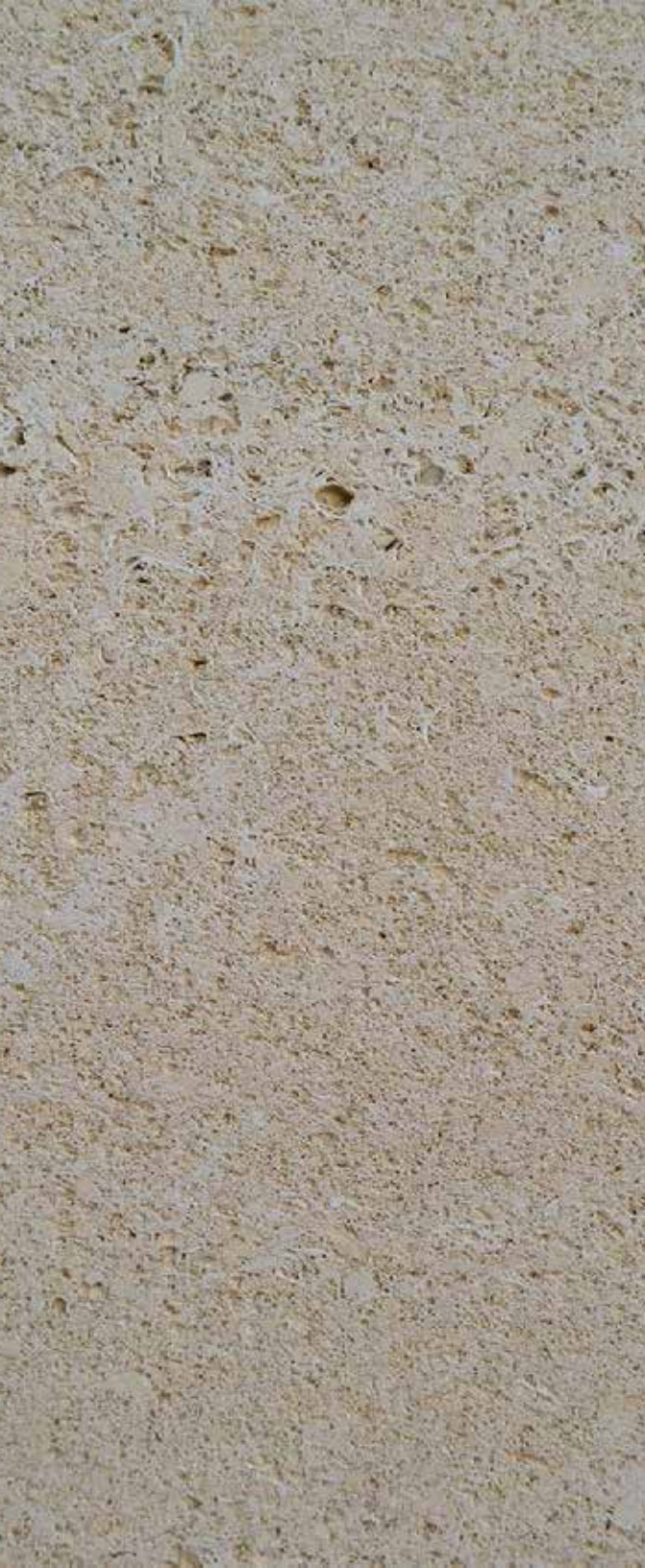
CALIZA NIWALA FÓSIL