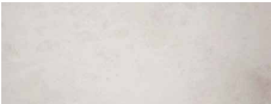
CALIZA CREMA DELICATO