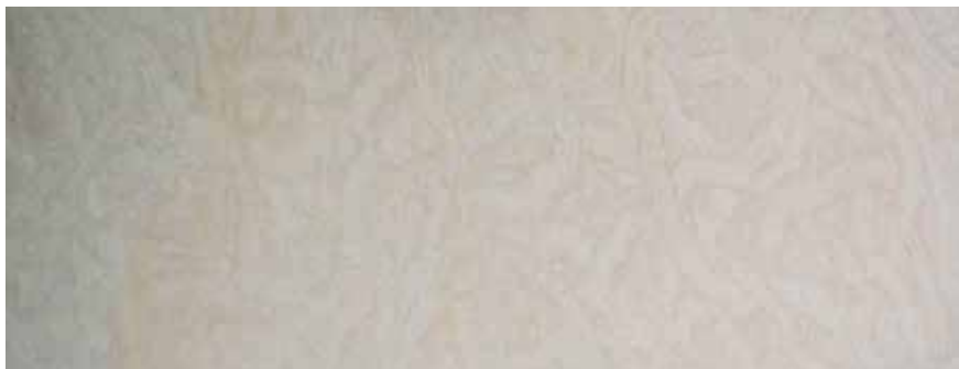
CALIZA FANTASY APOMAZADA