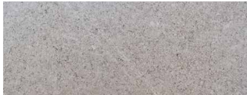
CANTERA BLANCA GALARZA