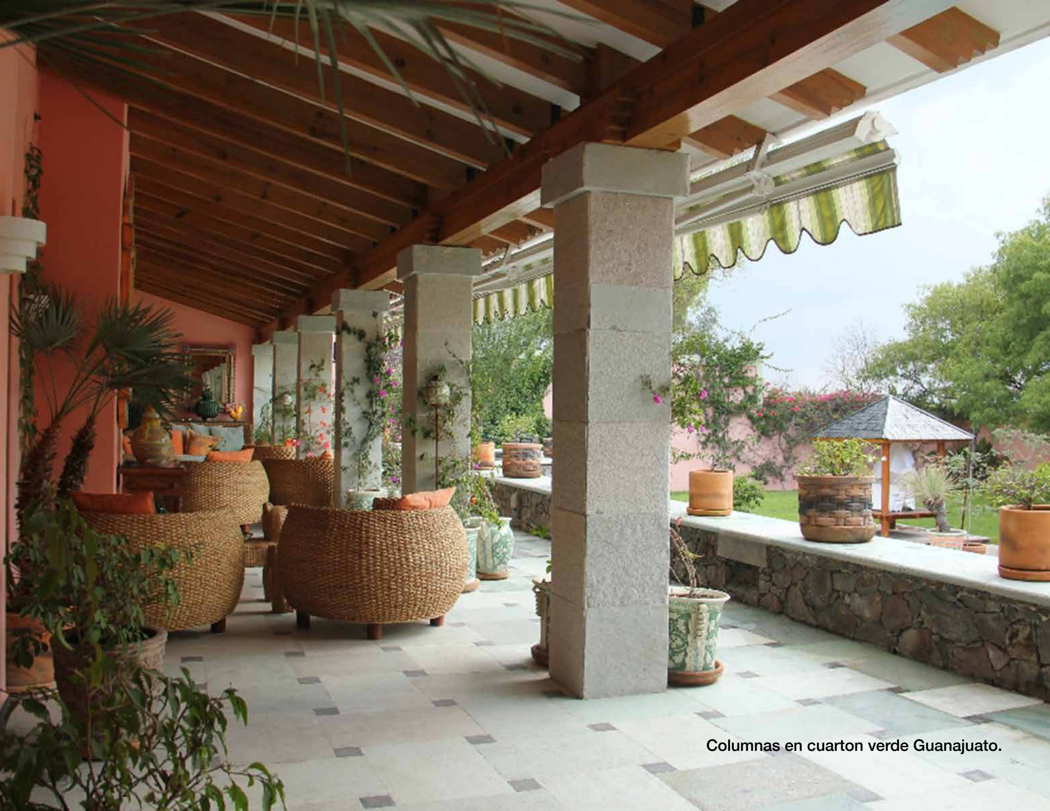
Columnas en cuarton verde Guanajuato.